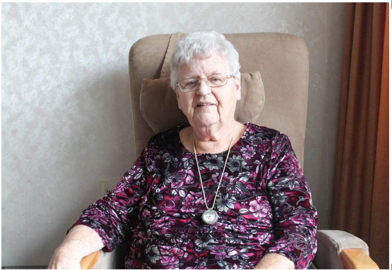
Meneer & mevrouw Maastricht

“ Het sluipt er allemaal in hè. Maar het is belangrijk dat de woning veilig is. ”