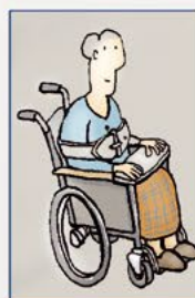
Fixatie in stoel