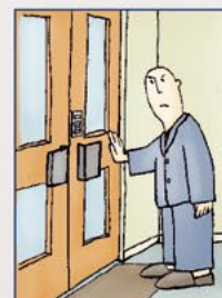
Gesloten afdelingen en afzondering in een kamer