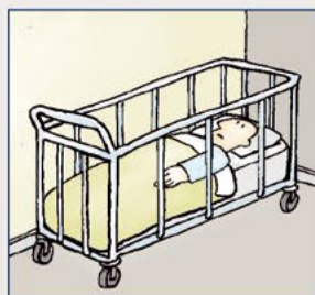
Opgesloten achter volledige beddekken