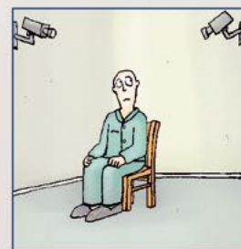
Verlies van privacy

Verlies van privacy is het negatieve bijeffect van veel moderne ICT hulpmiddelen, zoals cameratoezicht, bewegingssensoren etc. Deze middelen zijn veel minder vrijheidsbeperkend dan fysieke of psychosociale vrijheidsbeperking, maar dienen eveneens kritisch en uitsluitend op individuele indicatie te worden toegepast.