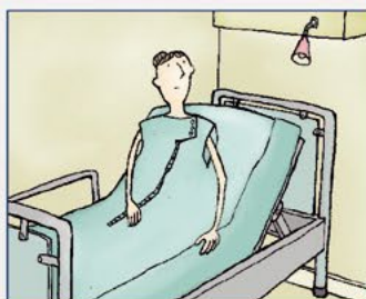
Fixatie met verpleegdeken of spanlaken