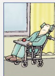
Vast tafelblad, diepe of gekantelde stoel