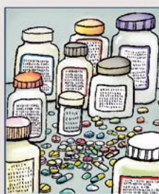
Overige gedragsbeïnvloedende medicatie