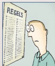
Vrijheidsbeperkende leefregels met betrekking tot leefstijl, sociale omgang etc.