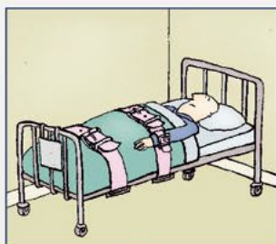
Fixatie in bed met een onrustband